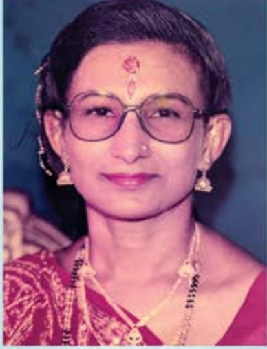
સ્વ.વીણાબેન પુશાલચંદ માઝ